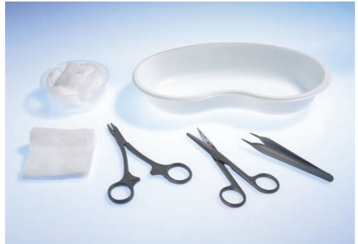
5061010 Wundversorgungs-Set 1