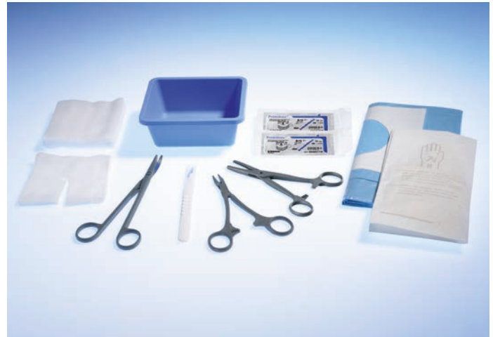
5062000 Thorax Drainage-Set, klein