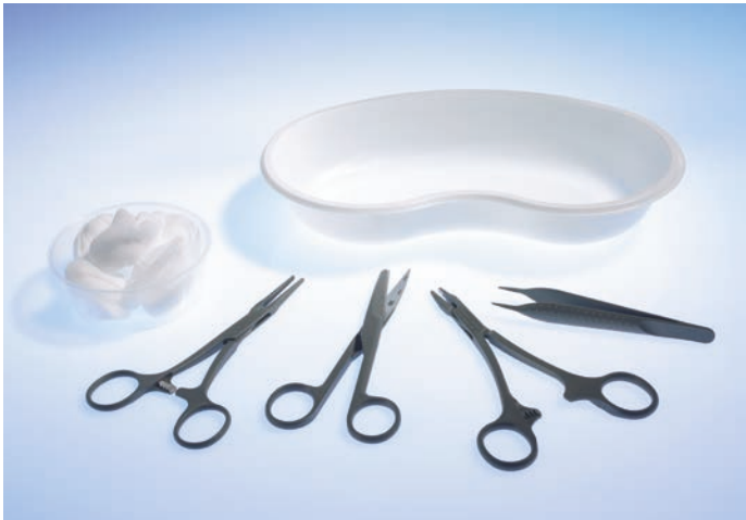
5061000 Naht-Set 1