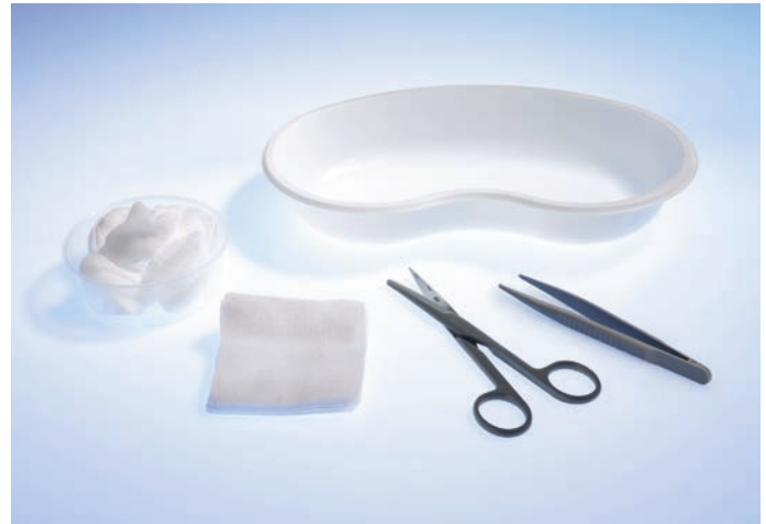
5061030 Wundversorgungs-Set 3