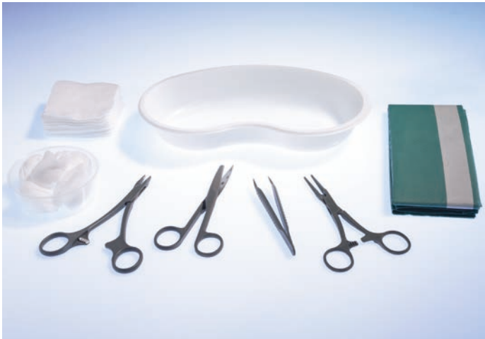
5061020 Wundversorgungs-Set 2