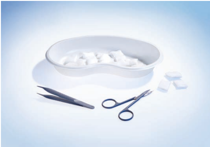
5061040 Fadenzieh-Set 1